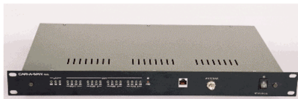
Abbildung 4: CAR-A-WAN.rail im 19"-Gehäuse

Da die Spannungsversorgung in einem Waggon durch ein kurzes Abheben des Stromabnehmers vom Fahrdrat Aussetzer zeigen kann, ist der CAR-A-WAN.rail mit einer zusätzlichen Pufferbatterie ausgestattet. Der verwendete WLAN Access Point hat darüber hinaus eine sog. Bridging-Funktion , so dass auch mehrere Access Points über die Luft miteinander verbunden und so mehrere Waggons mit einem CAR-A-WAN versorgt werden können.