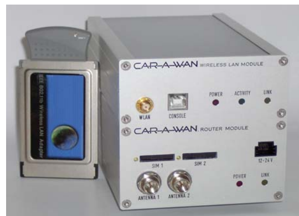
Abbildung 2: CAR-A-WAN.automotive, zum Größenvergleich mit WLAN-PCMCIA-Karte

Die technologische Entwicklung von Datenübertragung per Mobilfunk schreitet schnell voran. Einsetzbare Funkmodule sind häufig nur im Formfaktor einer PCMCIA-Karte erhältlich. Aus diesem Grund kommen im neuen CAR-A-WAN PCMCIA-Karten (auch PC-Karten genannt) zum Einsatz. Ändern sich die Mobilfunktechnologien (der Wechsel von UMTS zu HSDPA ist absehbar), brauchen nur die PCMCIA-Karten gewechselt und die entsprechenden Treiber aktualisiert werden.