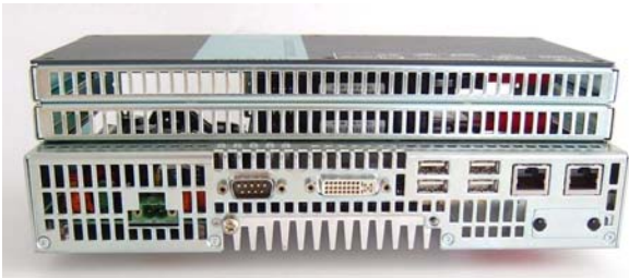
Abbildung 1: CAR-A-WAN.industrial, hier mit 2 UMTS-Karten

Neben einem RJ45-Kabelanschluss bietet der CAR-A-WAN optional einen Wireless LAN Access Point (WLAN; IEEE 802.11 b/g), mit dem das Gerät zum mobilen WLAN Hotspot wird. So können mehrere Nutzer komfortabel und ohne Kabelsalat mit einer Reichweite je nach Material der Wände von ca. 50m in Gebäuden/Fahrzeugen und bis zu 300m im Freien auf den Router zugreifen.